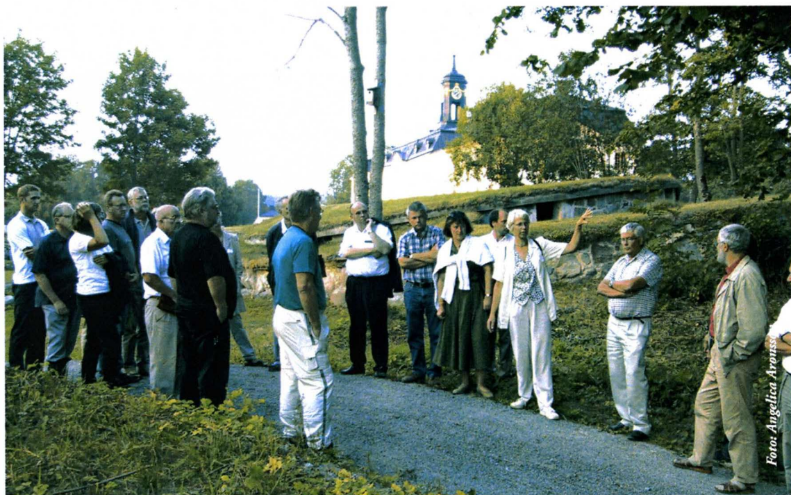
Demonstration av Svartsjöområdet våren 2002

Mälaröarnas Ornitologiska Förening har under åren 2000 till 2002 utfört ett mycket viktigt inventeringsarbete för att kartlägga vilka