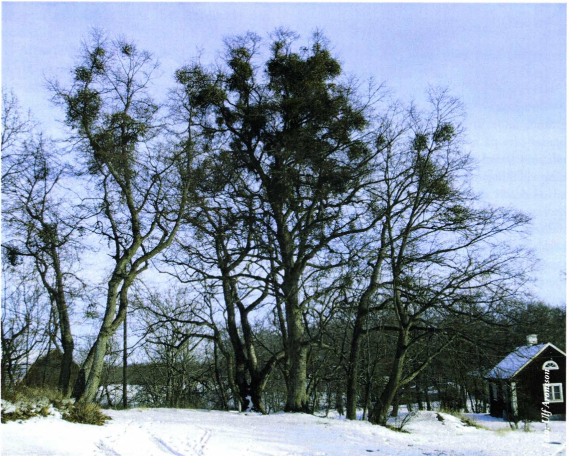
Mistelbestånd på Eldgarnsö

centrum bidrar till områdets värden. Det är inte bara hållbyggande fåglar som drar nytta av dessa gamla träd utan Eldgarnsö är Mälardalens mest