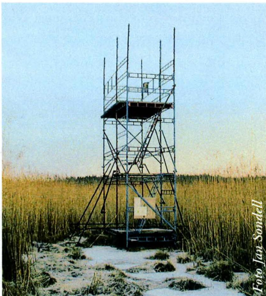
Det första fågeltornet vid Svartsjövik

Processen fram till bildandet av föreningen tog dock nästan tjugo år efter ett första försök för sedan för två decennier sedan. Då samlades nämligen en grupp ornitologer för att diskutera bildandet av någonformavfågelförening på Mäläröarna. Idéerna om en planerad verksamhet gick dock något isär. Försöket rann alltså ut i sanden och sedan kändes det som om frågan inte så lätt kunde omprövas. Men 2000 ville Ekerö kommun ha en representativ motpart för diskussioner om fågelskyddsfrågor i samband med startandet av Projekt Svartsjövik. Den 23 februari bildades i närvaro av 22 personer Mäläröarnas Ornitologiska Förening, MOF, vid ett möte i Tappström. Antalet medlemmar var vid det första årets slut 70 stycken. Mycket av föreningsarbetet de första åren kom alltså att handla om Svartsjöprojekt som infattade restaurering av våtmarksbeten vid viken. Syftet var att återskapa strandängarna och för-