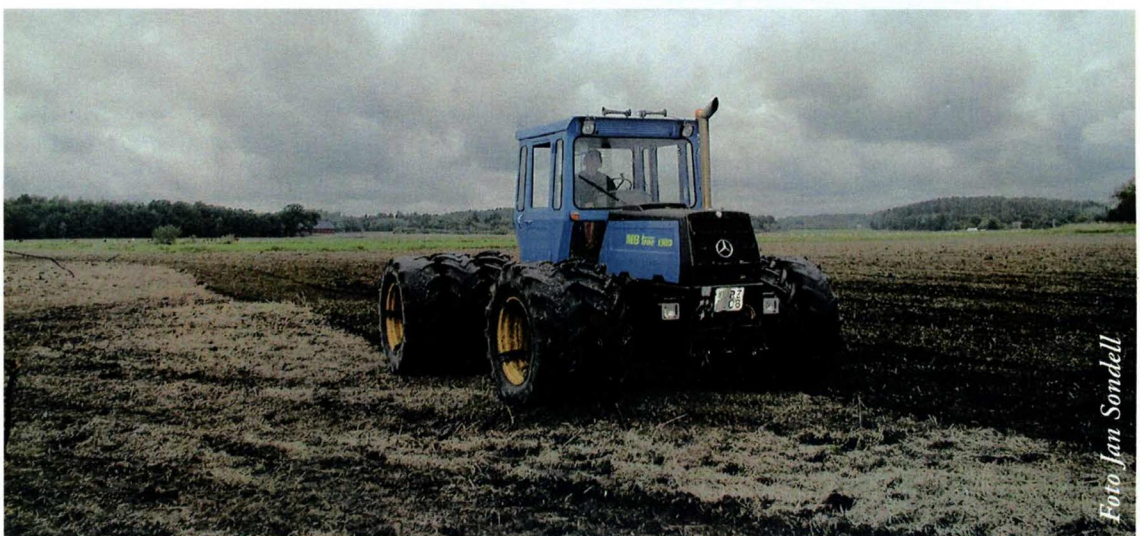
Markbearbetning i Svartsjöviken

Byggandet av ett permanent fågeltornet på östra sidan 2002 ökade ytterligare tillgängligheten vid viken. Sedan kunde man i stort sett spana av hela viken i tubkikaren från tornet. Vid Kumlavägen ordnades en fin parkeringsplats och en informationstavla och en gångstig märktes ut omkring viken. Då hade MOF redan börjat med exkursioner i området. Tornet nyttjades flitigt av oss