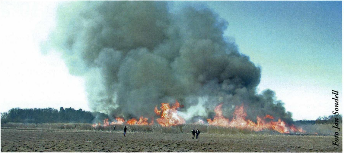
Vassbränning 2001 i Svartsjöviken

bälte som skymde insynen till en stor del av de öppna vattenspeglarna i mitten av viken.