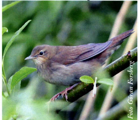
Flodsångare på Helgö

1 ex Eldgarnsö 9.5 (JLd), 1 ex Menhammarsviken 17.5–5.7 (MNn, UNn m.fl.), 1 ex 17.5–25.6 (JWn), 1 ex Eldgarnsö, 26.5 (JBk), 2 ex vid Dyängen, Munsö 30.5 (MMt), 1 ex Svartsjövikens 16–25.6 (JMn m.fl.), 1 ex Fladen, 24.6 (MBm, UAn), 1 ex Malmviks strandängar 14.7 (GCd).