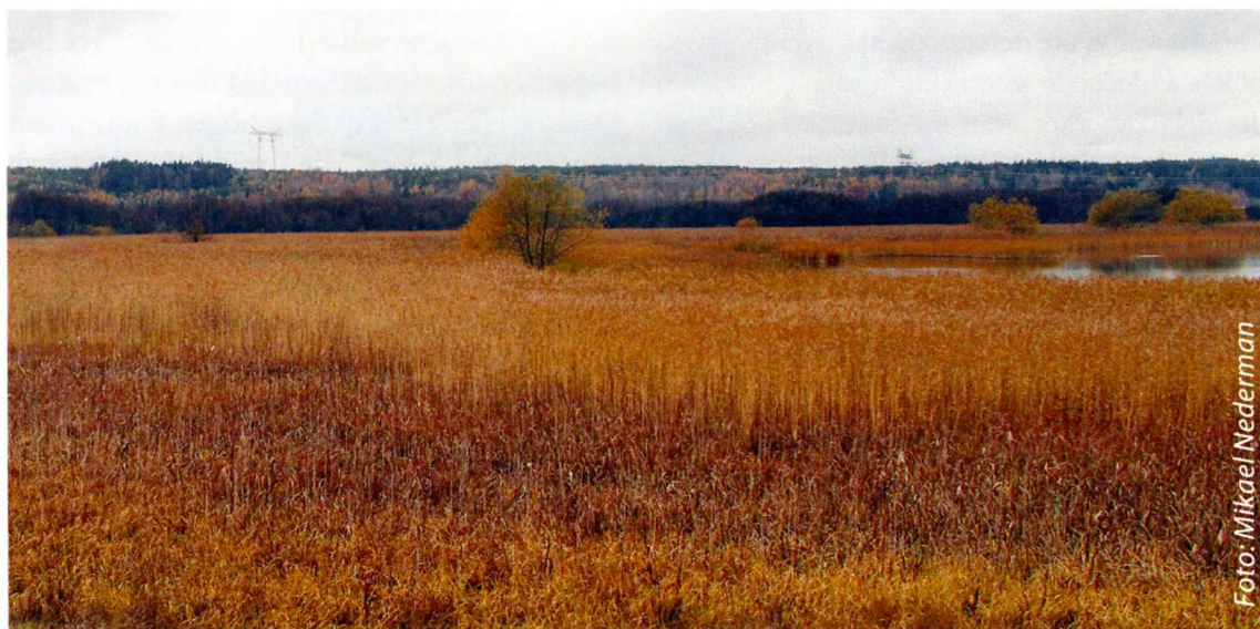
Vassen vid Menhammar hyser både brun kärrhök och rördrom. Några vassgator borde tas upp för att vi lättare ska se fåglarna.